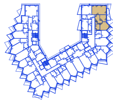
schéma umístění bytu