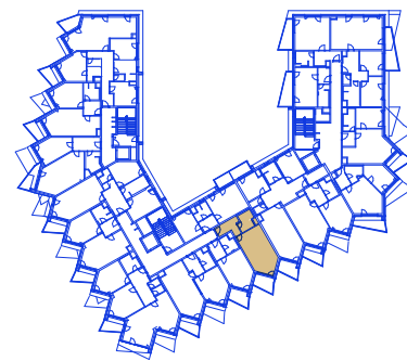
schéma umístění bytu