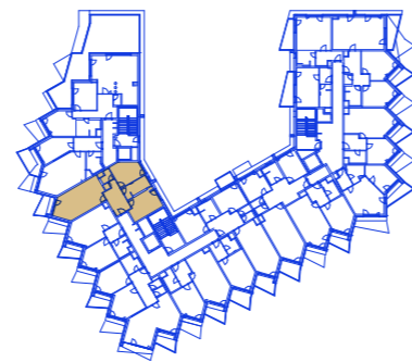
schéma umístění bytu