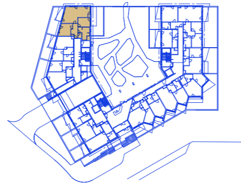
schéma umístění bytu