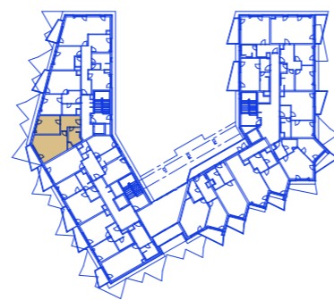
schéma umístění bytu